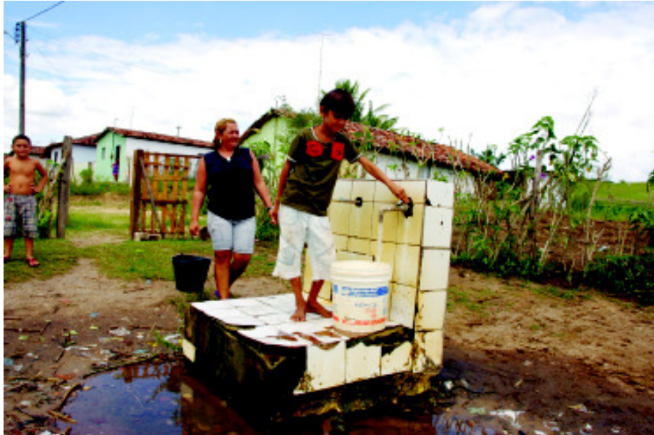
Depois de andar dois quilômetros, moradores são obrigados a "disputar" água com famílias de outras localidades; muitas vezes, o esforço é em vão, pois as duas únicas torneiras ficam secas

O convênio que teria sido celebrado em 2004 previa que a Funasa gastaria R$ 200 mil e a Prefeitura R$ 6.185,00 com obras como a perfuração de poços, a construção de rede de