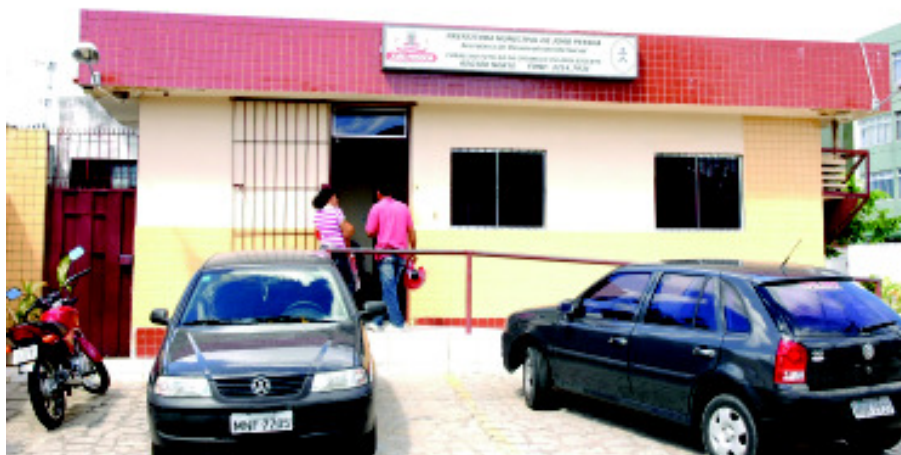
Objetivo do Ministério Público é estruturar e fortalecer os conselhos tutelares em todo o Estado

O levantamento da situação dos conselhos tutelares será feito a partir de questionários que estão sendo encaminhados pela equipe especializada aos promotores de Justiça da região. “Após essa etapa, os promotores vão receber