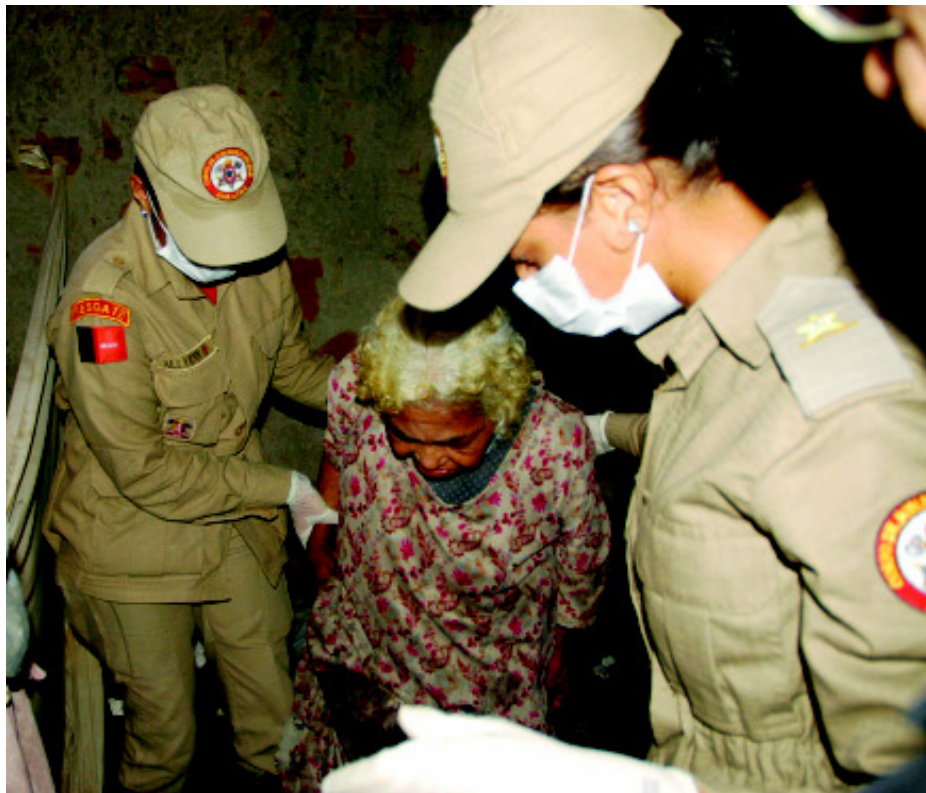
Idosa abandonada vivia em uma casa cheia de lixo, em João Pessoa. Ela foi resgatada pela equipe da Promotoria do Cidadão e Corpo de Bombeiros e levada para uma instituição

As Promotorias de Justiça do Cidadão das Comarcas de João Pessoa e Campina Grande registraram 512 denúncias de maus-tratos contra idosos, no ano passado. Isso significa dizer que, a cada dia, pelo menos, uma pessoa procura o Ministério Público, nas duas maiores cidades paraibanas, para denunciar esse problema. Na Capital, 34 pessoas com 60 anos ou