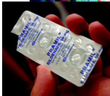
Três farmácias foram fechadas por fiscais da Vigilância Sanitária por comercializarem medicamentos ilegais. Na operação foram recolhidos 63 comprimidos de Pramil (detalhe à esquerda). O medicamento usado no tratamento da disfunção erétil é proibido no Brasil.