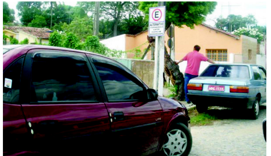
Alternativos devem parar a uma distância mínima de 500 metros das paradas oficiais de ônibus, táxis e mototáxis

Em abril, foram estabelecidas regras para a operação dos alternativos. Foi acertado que os veículos devem ficar a uma distância mínima de 500 metros em relação à Viação Rio Tinto e às praças de táxi e mototaxistas oficiais. A exceção é a praça nº 03 (destino João Pessoa). "Já oficiamos ao Comando da Polícia Militar, para que disponibilize um guarda de trânsito para fiscalizar as praças de taxistas e alternativos situados