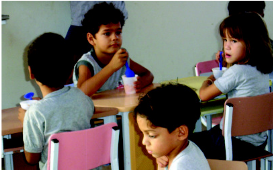
Lei quer garantir alimentação escolar de qualidade e gerar renda para os pequenos produtores

Embora a Lei 11.947/09 (“Lei da Alimentação Escolar”) determine que 30% dos recursos repassados pelo Fundo Nacional de Desenvolvimento da Educação (FNDE) para a alimentação escolar devam ser destinados à aquisição de produtos da agricultura familiar e do empreendedor familiar rural, a maioria das escolas não cumpre esse percentual. Dentre os motivos para o descumprimento estão os entraves fiscais e burocráticos que dificultam a participação dos pequenos produtores nas chamadas públicas, o desconhecimento sobre a lei e a