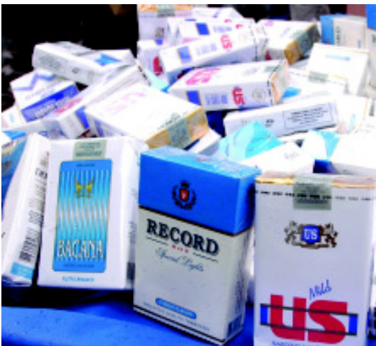
Cigarros falsificados e contrabandeados dificultam o combate ao tabagismo, em todo o Brasil

O Ministério Público da Paraíba e a Agência Estadual de Vigilância Sanitária (Agevisa) lançou, no dia 14 de maio, a campanha "Comercializar Cigarros Contrabandeados e Falsificados é Crime". O objetivo é coibir a venda de cigarros irregulares e proteger a saúde do paraibano.