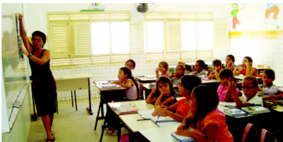
Ir à escola é uma das exigências que as crianças beneficiadas com o Bolsa Família devem atender

Também participaram da audiência representantes do Programa de Erradicação do Trabalho Infantil, dos Centros de Referência de Assistência Social e da Secretaria Municipal de Saúde.