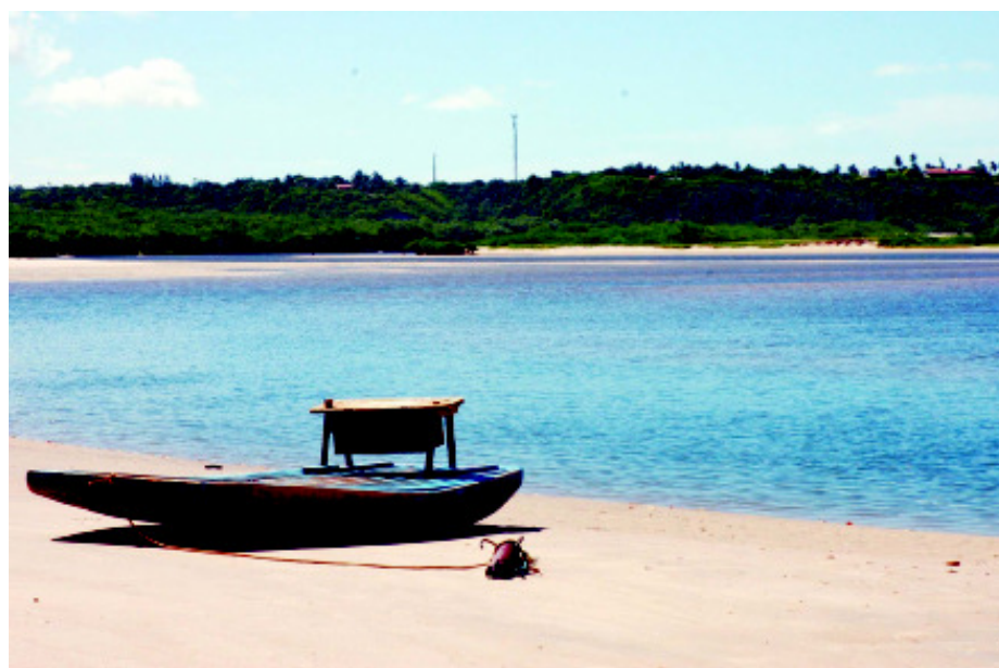
Pesquisas realizadas pela UFPB constataram que a bacia recebe grande quantidade de metais pesados e que, em alguns pontos, já não há mais mata ciliar

Outra força-tarefa será coordenada pelo MPF para conscientizar os donos de estabelecimentos agropecuários sobre a necessidade e as vantagens da adequação à lei ambiental. O