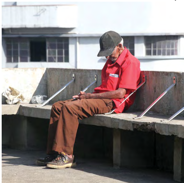
DESRESPEITO - Abandono e exploração são as principais violências