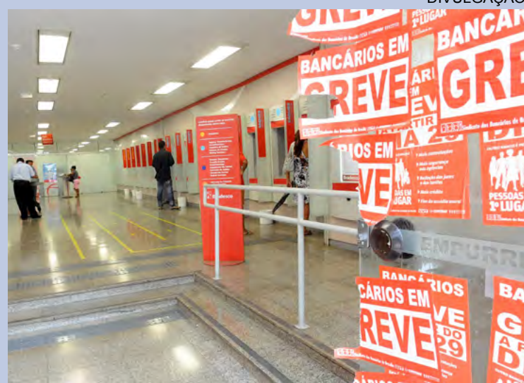
GREVE - paralisação nas agências bancárias durou uma semana

No período da greve, a promotoria de Justiça promoveu audiências com representantes dos Procons Estadual e Municipal e dos bancos Bradesco, do Brasil, Itaú, HSBC e do Nordeste para discutir a greve dos bancários