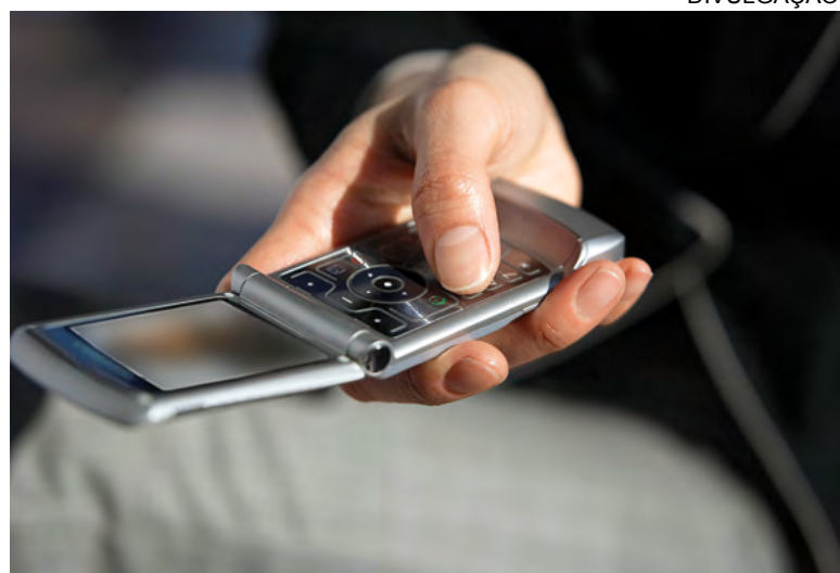
SEM SINAL - Usuários ficaram sem comunicação em JP e CG