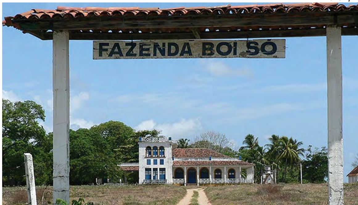
FAZENDA BOI SÓ - foi considerada patrimônio histórico em 1980, através de decreto estadual.

A “Fazenda Boi Só” foi considerada patrimônio histórico e cultural da cidade de João Pessoa e do Estado da Paraíba em agosto de 1980, através do Decreto 8.656. A fazenda