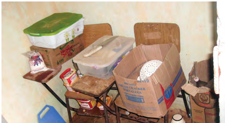
EMEF ALVILINO RIBEIRO - Local onde alimentos eram guardados