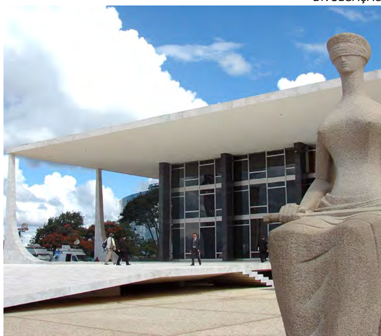
STF - Em Brasília, ministros julgaram procedente ação do MPPB

De acordo com o STF, a legislação que não cumpre esses