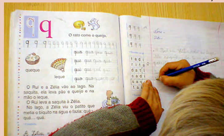
FUNDEB - recursos da educação foram usados para outros fins