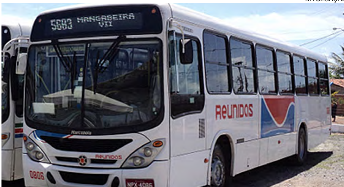
INSEGURO - veículos sem manutenção faziam o transporte de passageiros, em bairros da zona sul de JP