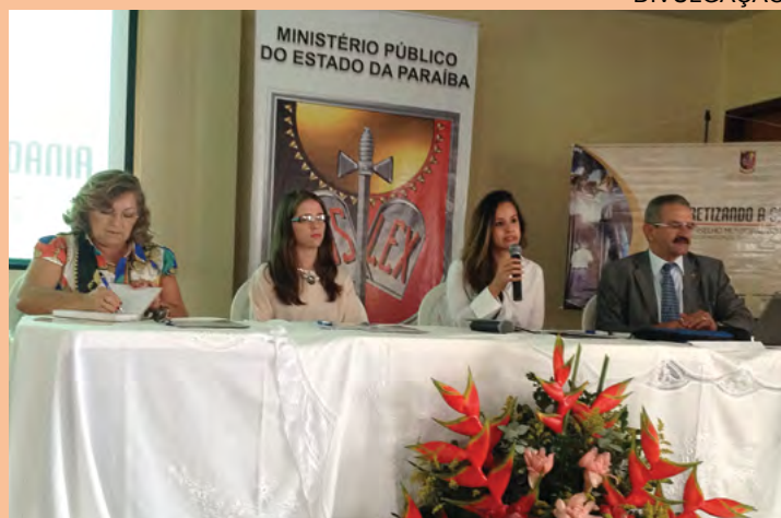
EM GUARABIRA - Palestrantes falaram sobre leis do idoso