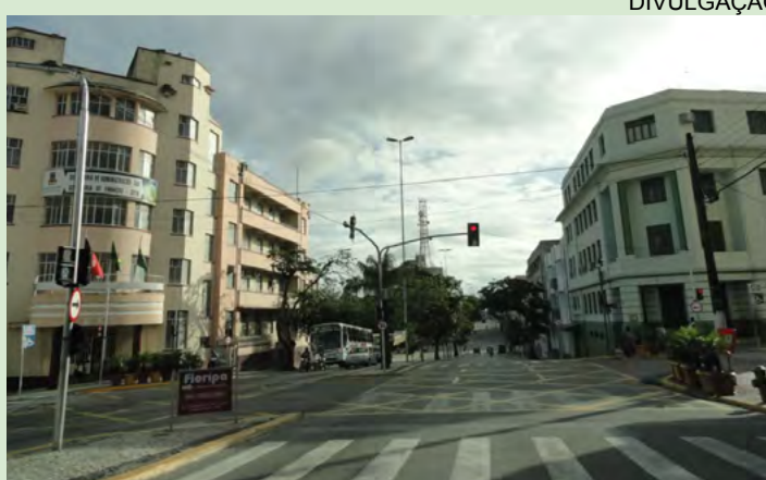
IMPASSE - Árvores da av. Floriano Peixoto poderão ser derrubadas